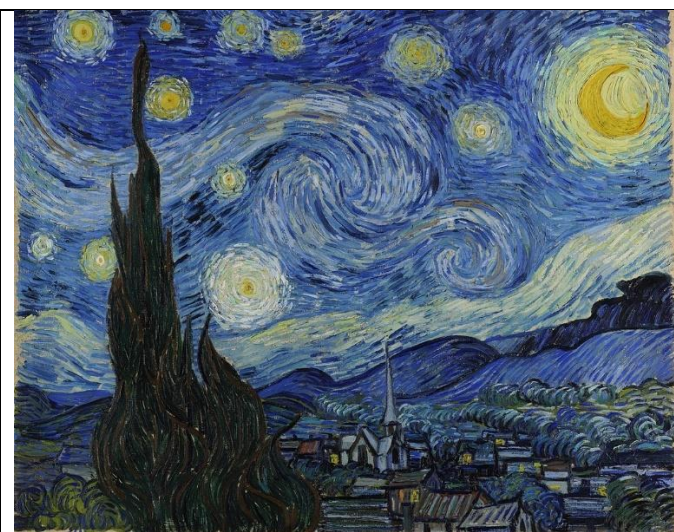
La Nuit étoilée (1889), Vincent van Gogh

Il peut aussi montrer une photographie ou une peinture contenant Lune de ce type :