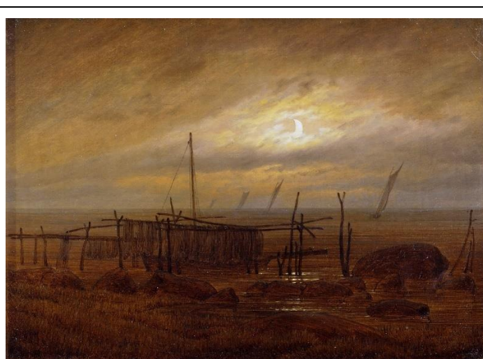
Bord de mer au clair de lune (1812), Caspar David Friedrich

https://fr.wikipedia.org/wiki/La_Nuit_étoilée_(1889)