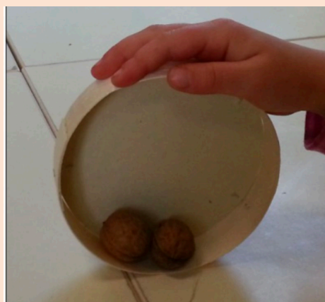
Autre fabrication possible

Ces défis sont proposés par les équipes du réseau des Centres pilotes La main à la pâte